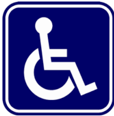
สัญลักษณ์ผู้พิการ